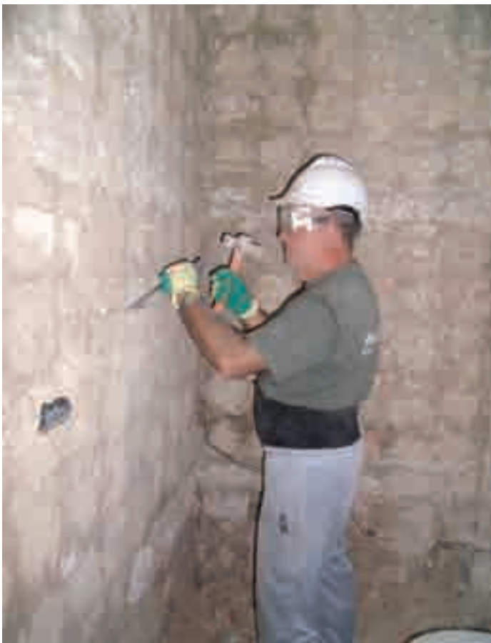
Figura 2. Preparación del soporte

Antes de aplicar la pasta de yeso es preciso preparar la superficie soporte. Se deben eliminar los salientes o abultamientos excesivos existentes mediante golpes dados con el canto de la paleta o, preferentemente, con la picoleta. Todo ello para garantizar un revestimiento de espesor similar en toda la superficie.