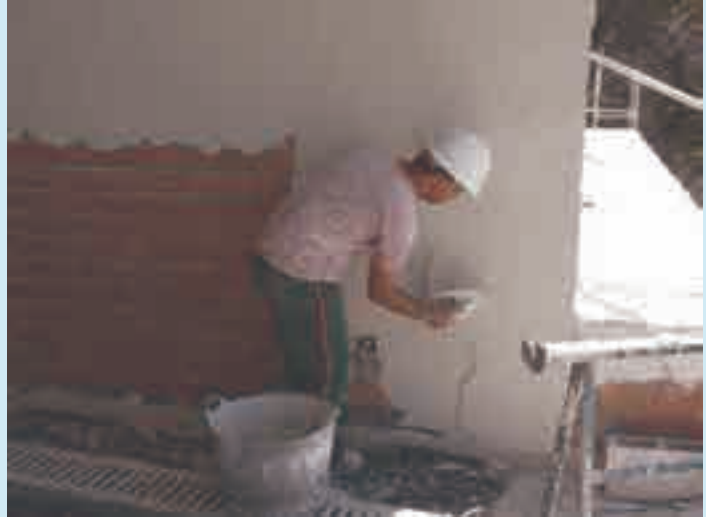
Figura 3. Guarnecido de yeso

A continuación se aplica el enlucido, con pasta de yeso fino, de un espesor entre 1 y 3 mm, quedando el revestimiento con un acabado más fino y satinado.