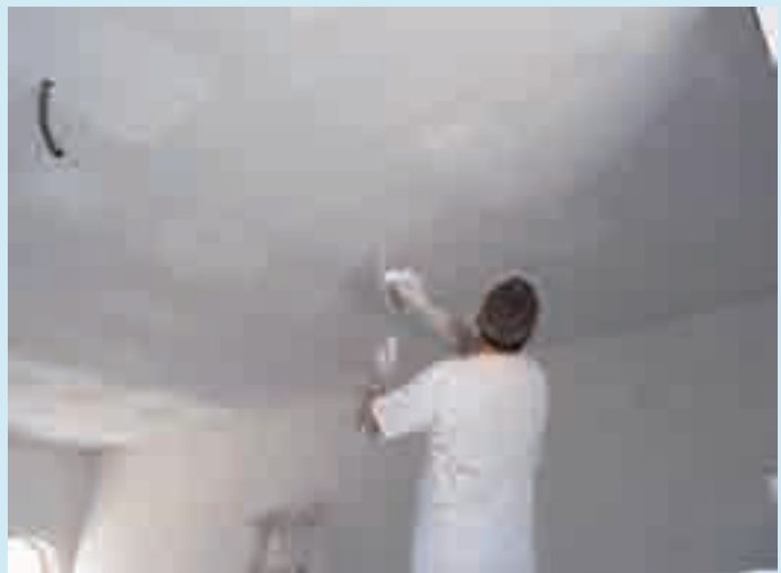
Figura 4. Enlucido de yeso