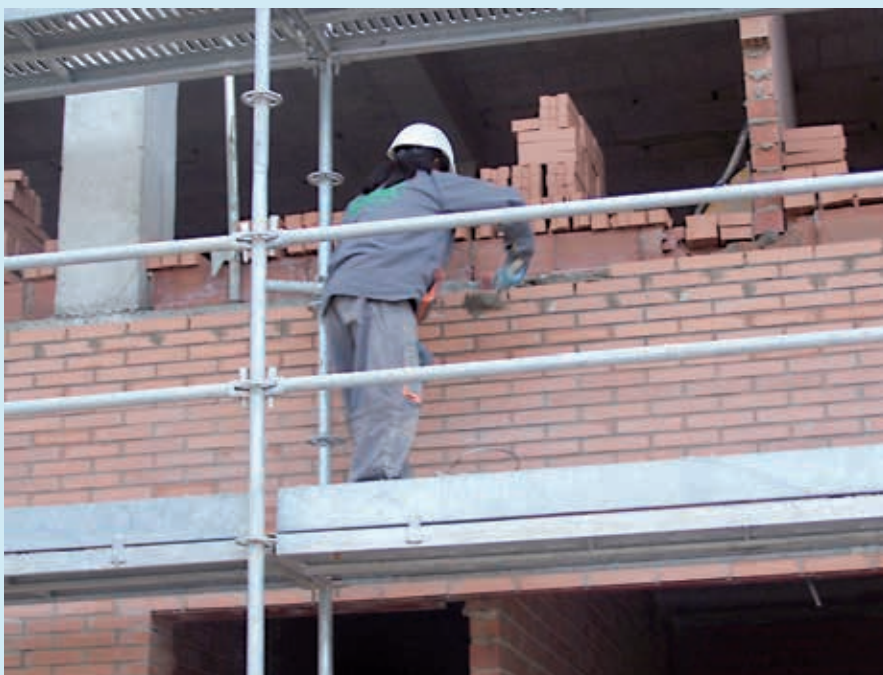
Figura 1. Ejecución de cerramiento exterior mediante obra de fábrica de ladrillo visto