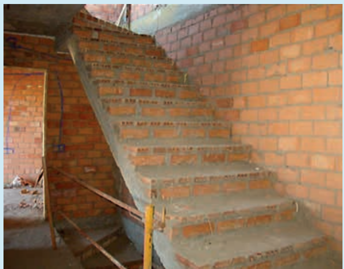
Figura 3. Ejecución del peldañado de la escalera con ladrillos y mortero