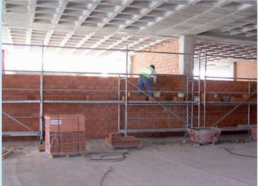
Figura 2. Ejecución de tabiques de separación interior constituidos por obras de fábrica de ladrillo