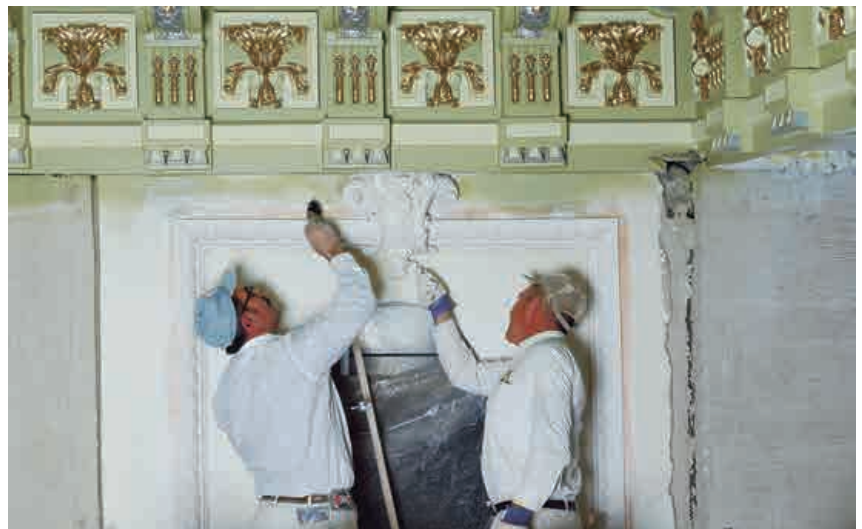
Figura 1. Escayolistas