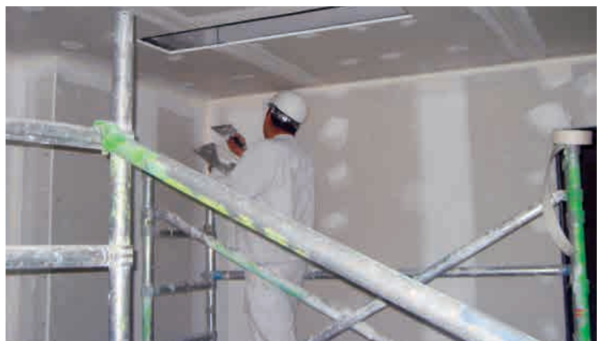
Figura 2. Colocador de placas de yeso laminado