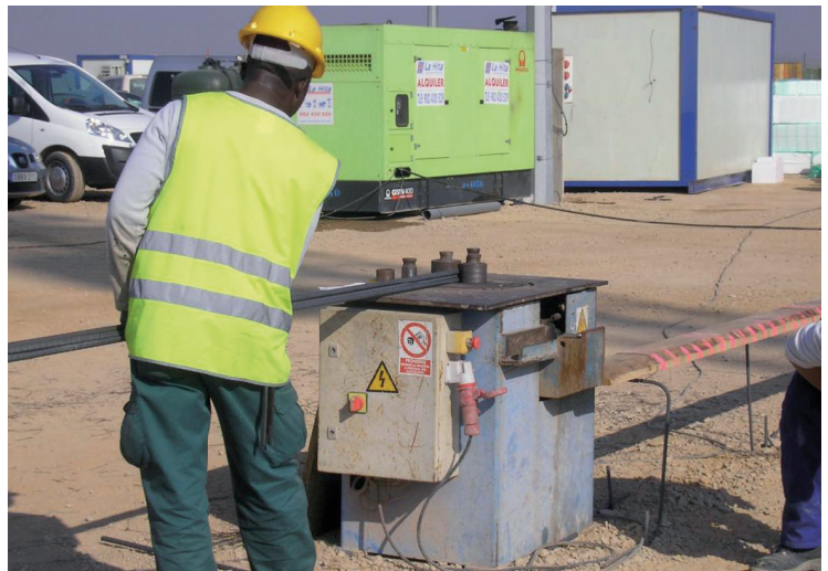
Figura 1. Operación de doblado de ferralla

Se define como armadura elaborada cada una de las formas o disposiciones de ferralla que resultan de aplicar, en su caso, los procesos de enderezado, corte y doblado a partir de barras de acero corrugado o, en su caso, de mallas electrosoldadas.