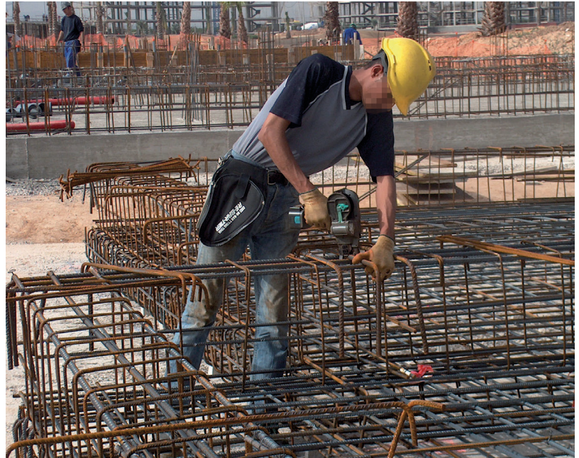
Figura 5 Atado mecánico de armaduras

Las operaciones de ferrallado se llevan a cabo, en parte, en un taller externo o, en su totalidad, en la misma obra.