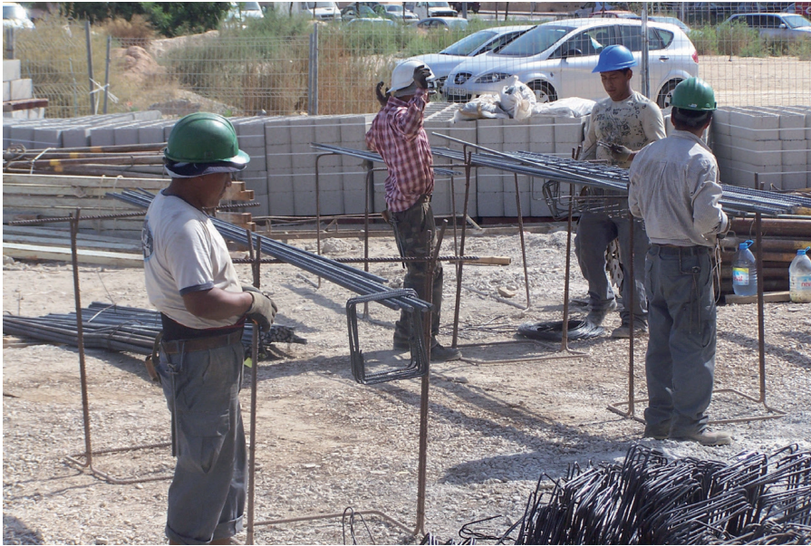
Figura 3. Unión de armaduras mediante atado por alambre

La unión de las armaduras mediante atado por alambre se puede realizar de forma manual o mecánica.