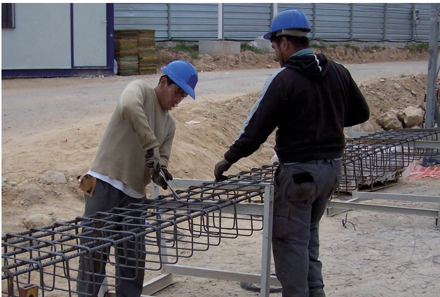
Figura 4. Atado manual de armaduras

La unión de las armaduras mediante atado por alambre se puede realizar de forma manual o mecánica.