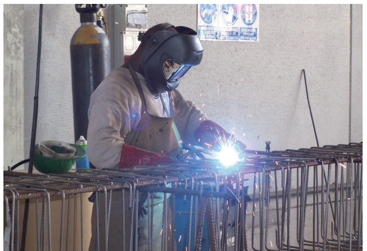
Figura 2. Unión de armaduras mediante soldadura

Se denomina ferralla armada al resultado de aplicar a las armaduras elaboradas los correspondientes procesos de armado mediante atado por alambre o mediante soldadura no resistente.