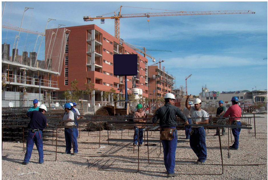
Figura 6 Taller de ferrallado en obra

Las operaciones de ferrallado se llevan a cabo, en parte, en un taller externo o, en su totalidad, en la misma obra.