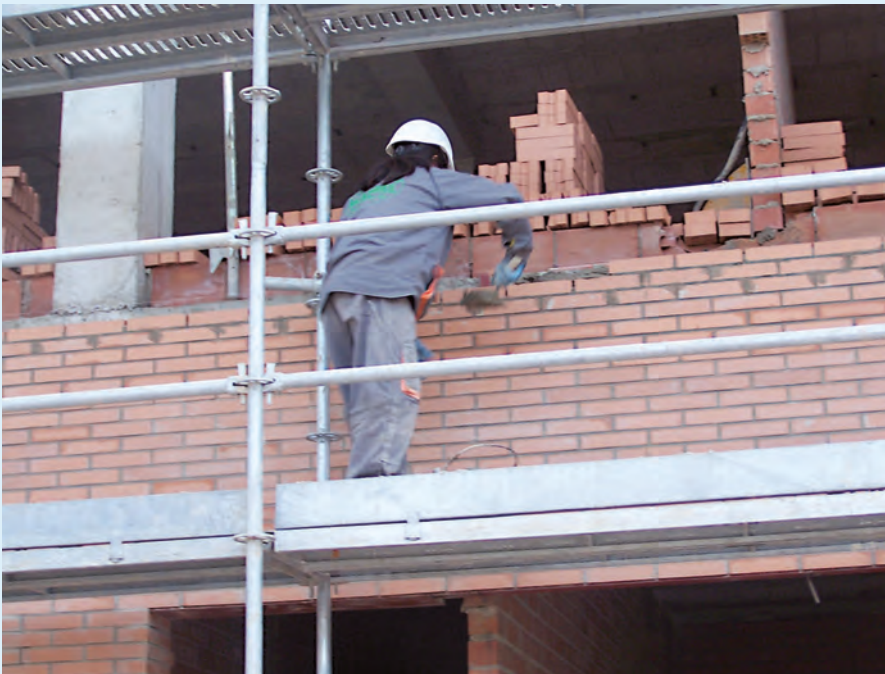
Figura 1. Ejecución de cerramiento exterior mediante obra de fábrica de ladrillo visto