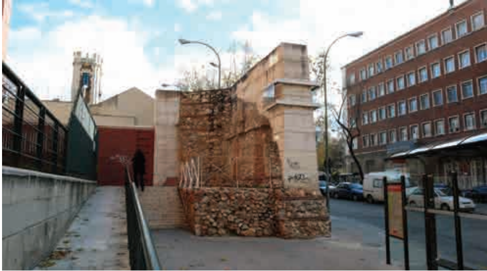
Figura 1. Restos de la Cerca de Felipe IV (Madrid)