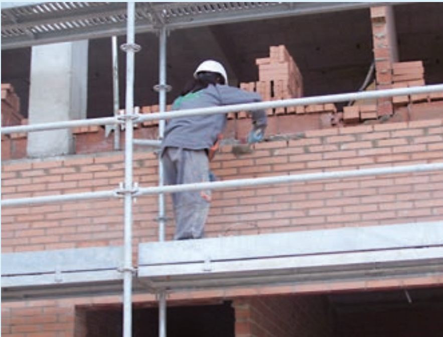
Figura 1. Ejecución de cerramiento exterior mediante obra de fábrica de ladrillo visto