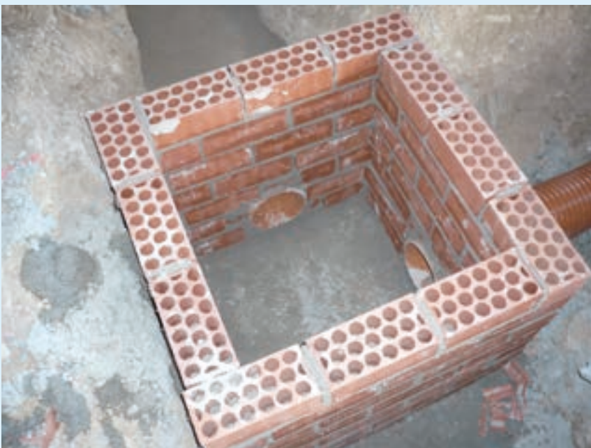
Figura 5. Ejecución de las arquetas de la red enterrada de saneamiento mediante obra de fábrica