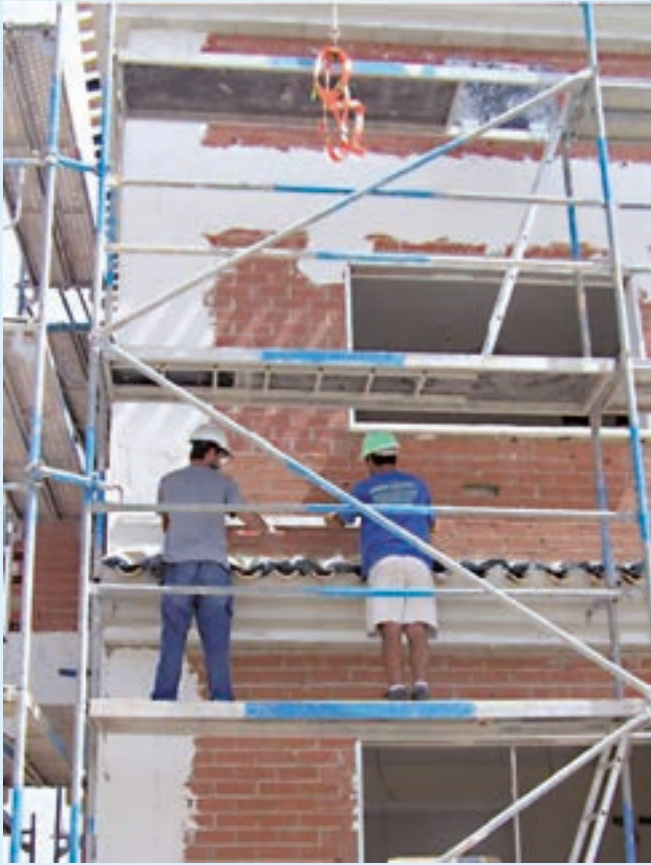
Figura 4. Ejecución de revestimiento continuo en cerramiento exterior